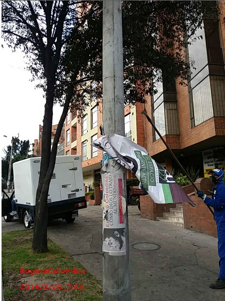
Fotografía No. 3. Elementos instalados en Espacio Público. Operativo en la Localidad de Usaquén, día 20 de Febrero de 2016. Pendones desmontados en la Cr. 7 con Cll. 129