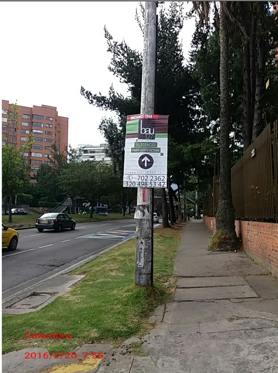
Fotografía No. 4. Elementos instalados en Espacio Público. Operativo en la Localidad de Usaquén, día 20 de Febrero de 2016. Pendones desmontados en la Cr. 7 con Cll. 127C