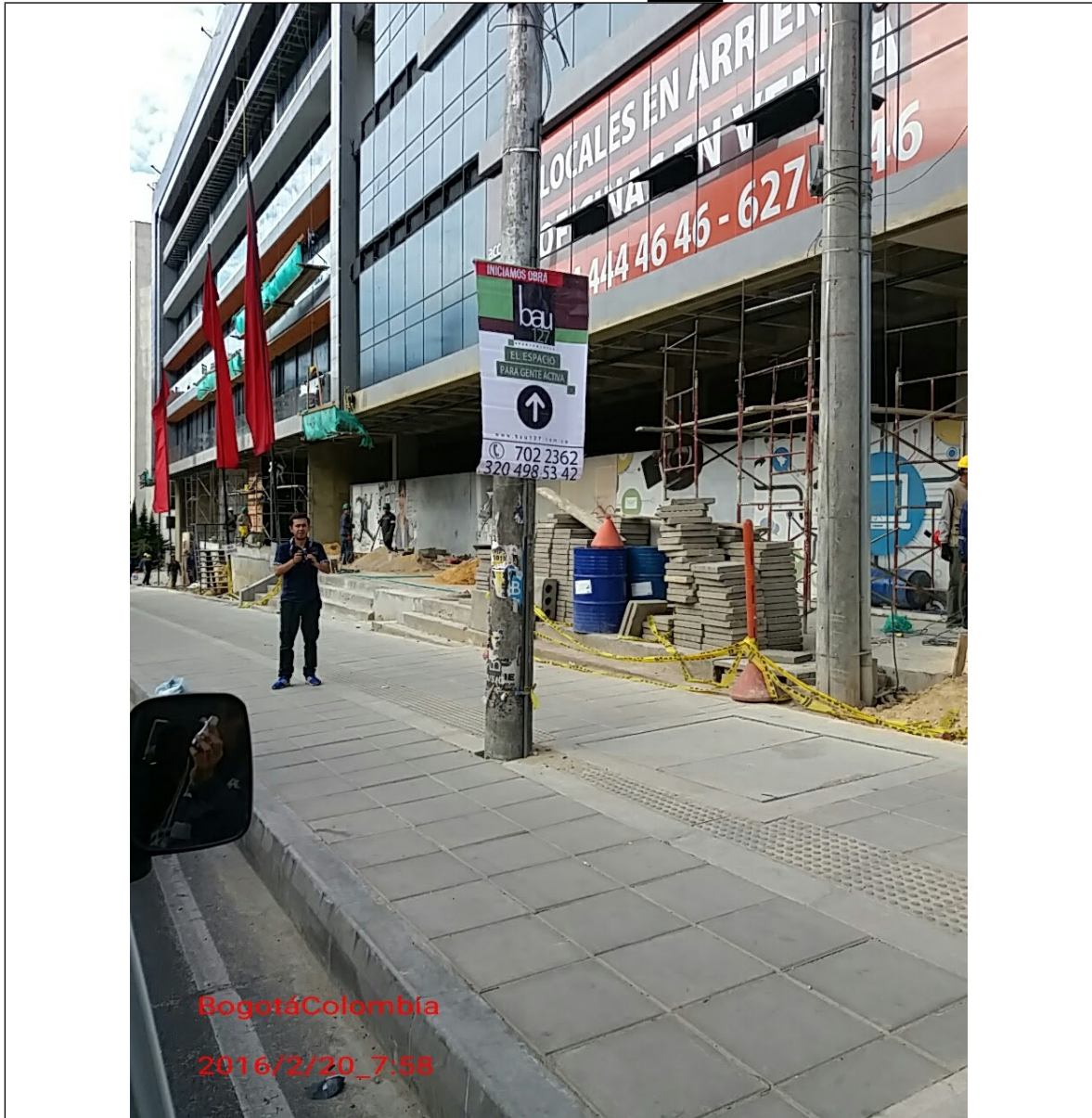
Fotografía No. 6. Elementos instalados en Espacio Público. Operativo en la Localidad de Usaquén, día 20 de Febrero de 2016. Pendones desmontados en la Cr. 7 con Cll. 127 A