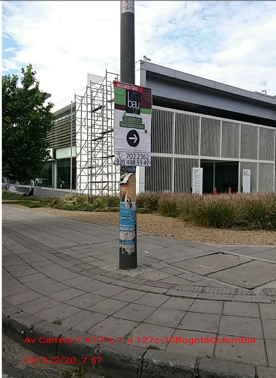
Fotografía No. 5. Elementos instalados en Espacio Público. Operativo en la Localidad de Usaquén, día 20 de Febrero de 2016. Pendones desmontados en la Cr. 7 con Cll. 127 B