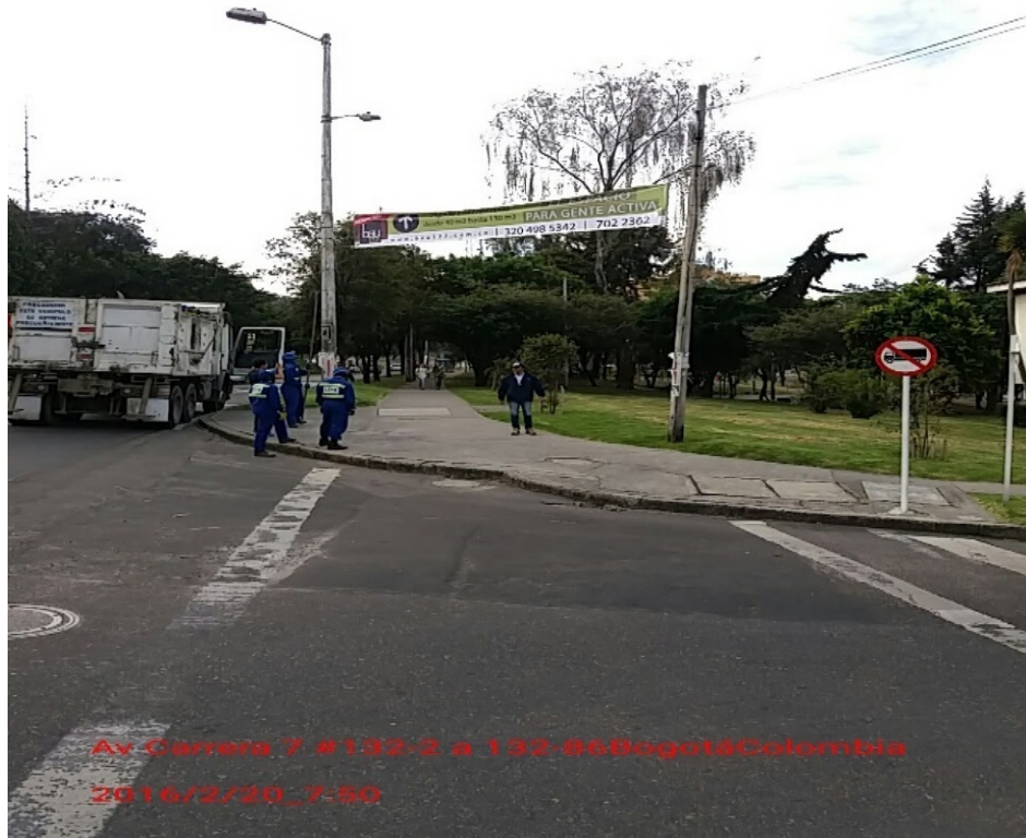
Fotografía No. 2. Elementos instalados en Espacio Público. Operativo en la Localidad de Usaquén, día 20 de Febrero de 2016. Pasacalles desmontados en la Cr. 7 No. 132-68