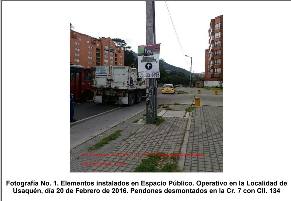
Fotografía No. 1. Elementos instalados en Espacio Público. Operativo en la Localidad de Usaqué, día 20 de Febrero de 2016. Pendones desmontados en la Cr. 7 con CII. 134

Registro fotográfico, Operativo de Control efectuado el día 20/02/2015